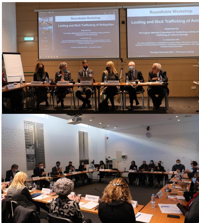
Roundtable "Looting and Illicit Trafficking of Antiquities".