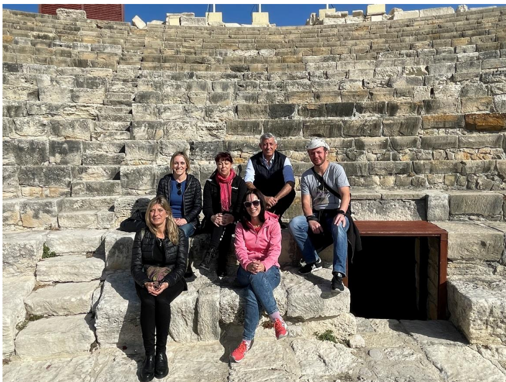
EuroTeCH partners in Kourion