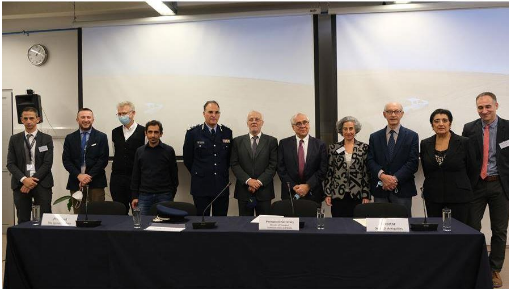
Ceremony of the renewal of Memorandum of Understanding (MoU) between the Cyprus Institute, the Cyprus Police and the Department of Antiquities of Cyprus