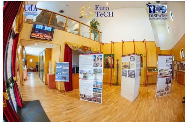
Mostra: Libia E Italia tra Storia, Archeologia, Arti e Cultura