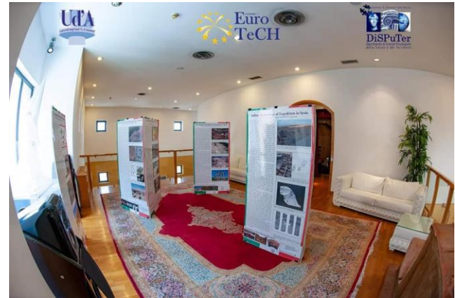
Mostra Documentaria: IAM 2. Italian Archaeology in Egypt and MEN Countries.