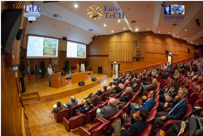
FOTO DELL'EVENTO/PHOTOS OF EVENT