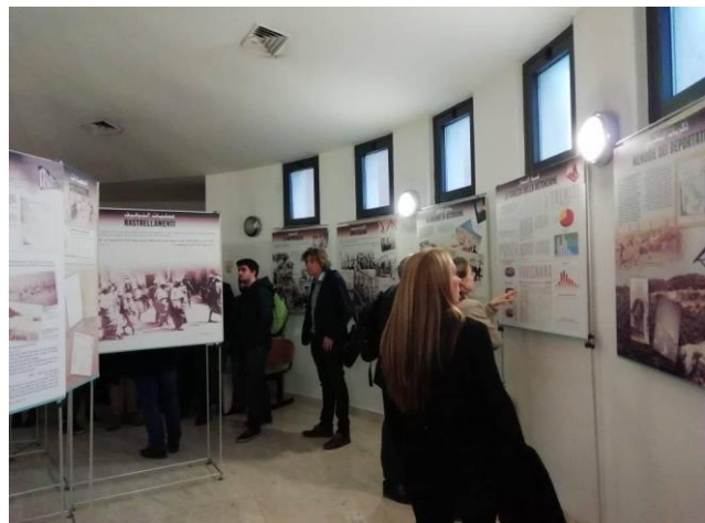
Mostra Foto-documentaria: L'occupazione italiana della Libia. Violenza e colonialismo (1911-1943).